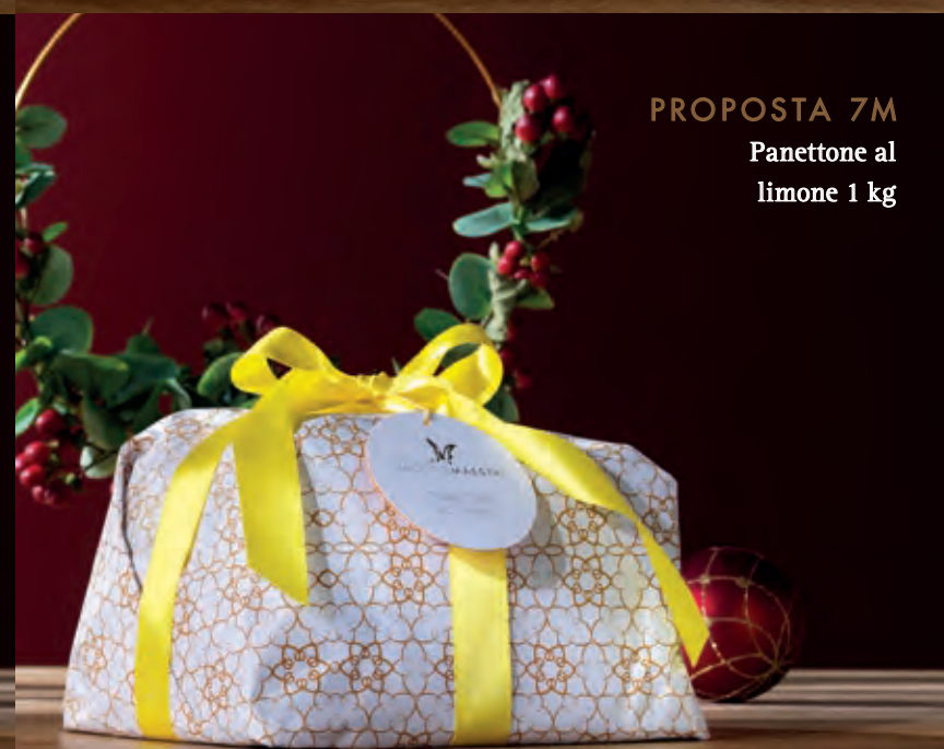
PROPOSTA 7M Panettone al limone 1 kg