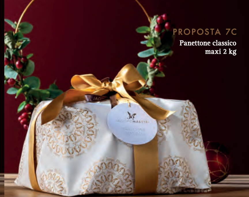
PROPOSTA 7C Panettone classico maxi 2 kg