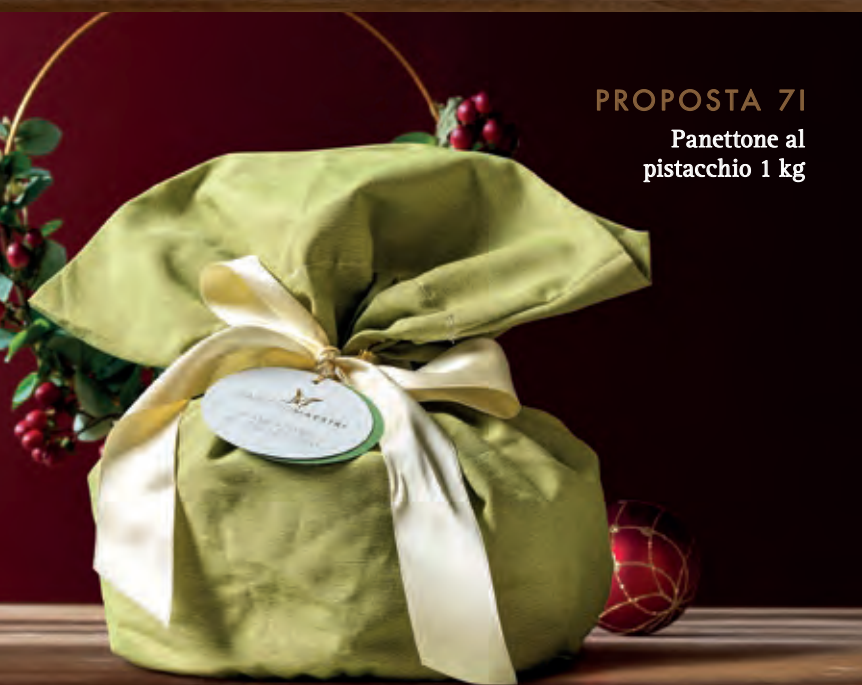
PROPOSTA 7I Panettone al pistacchio 1 kg