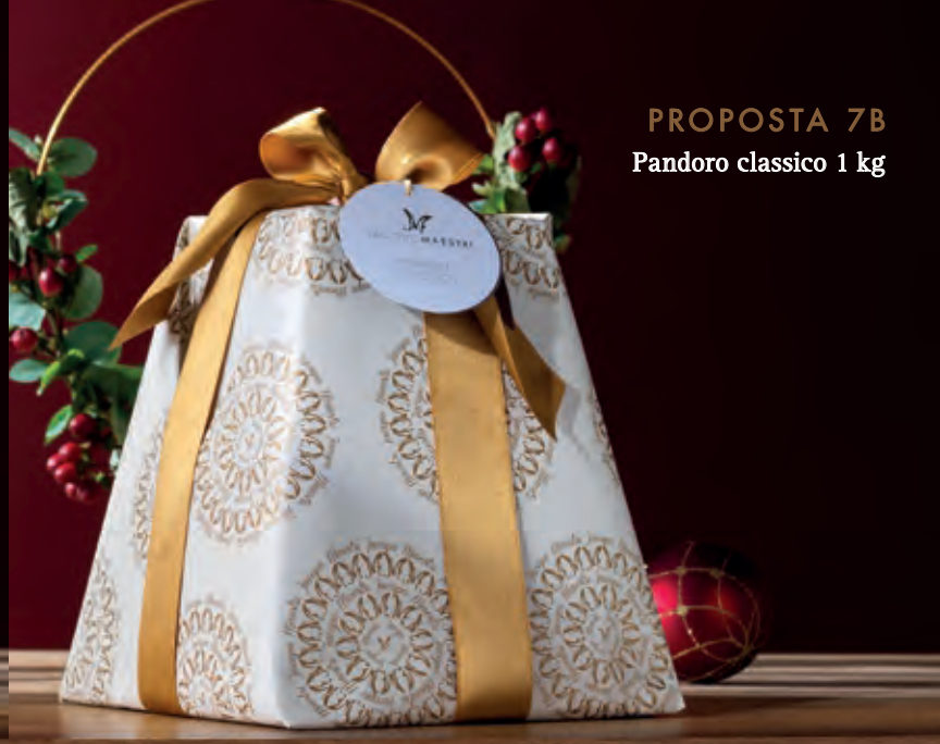
PROPOSTA 7B Pandoro classico 1 kg