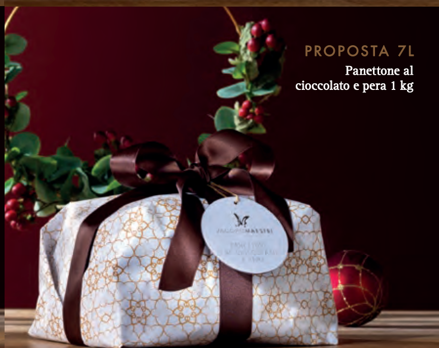
PROPOSTA 7L Panettone al cioccolato e pera 1 kg