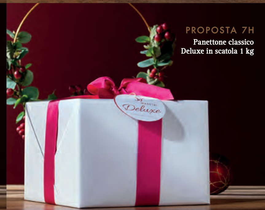
PROPOSTA 7H Panettone classico Deluxe in scatola 1 kg