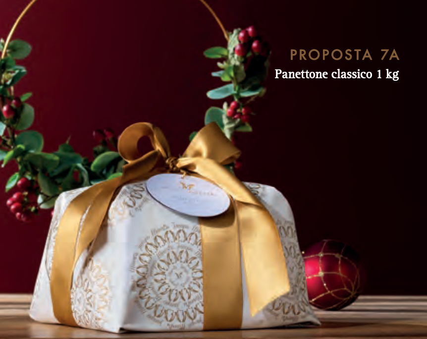
PROPOSTA 7A Panettone classico 1 kg