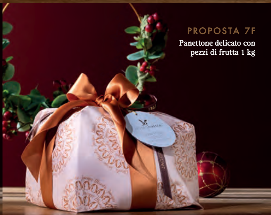
PROPOSTA 7F Panettone delicato con pezzi di frutta 1 kg