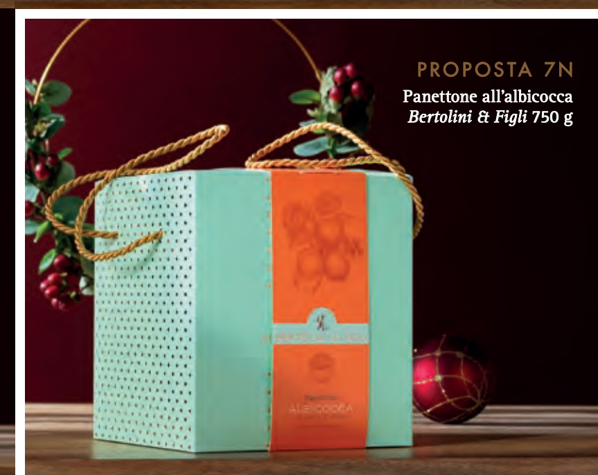
PROPOSTA 7N Panettone all'albicocca Bertolini & Figli 750 g