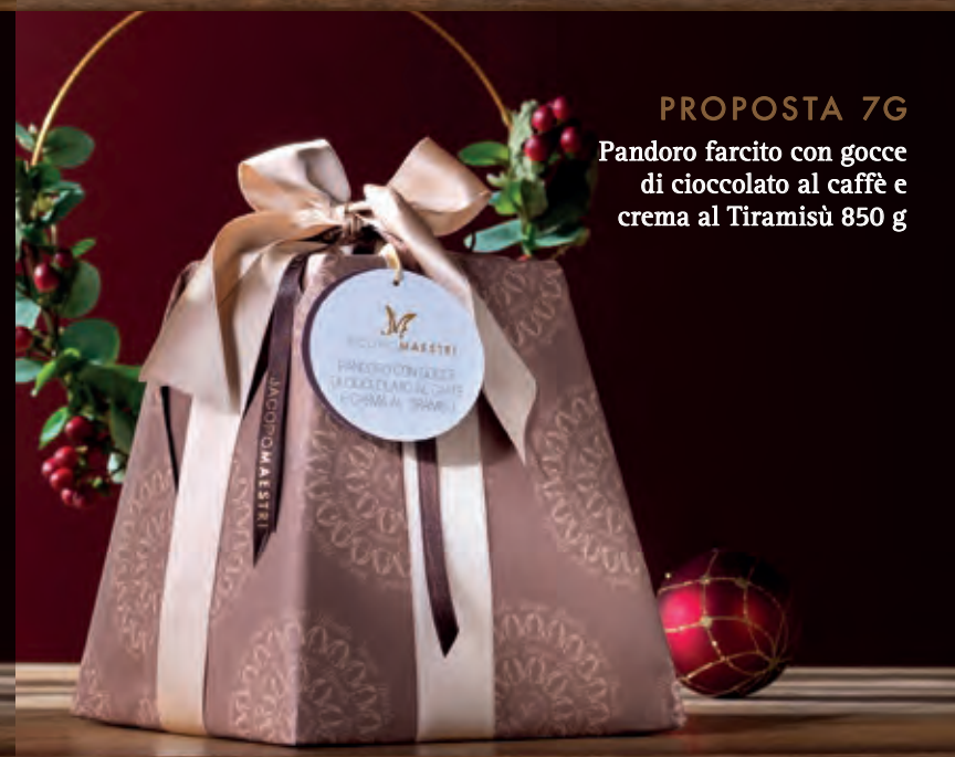
PROPOSTA 7G Pandoro farcito con gocce di cioccolato al caffè e crema al Tiramisù 850 g