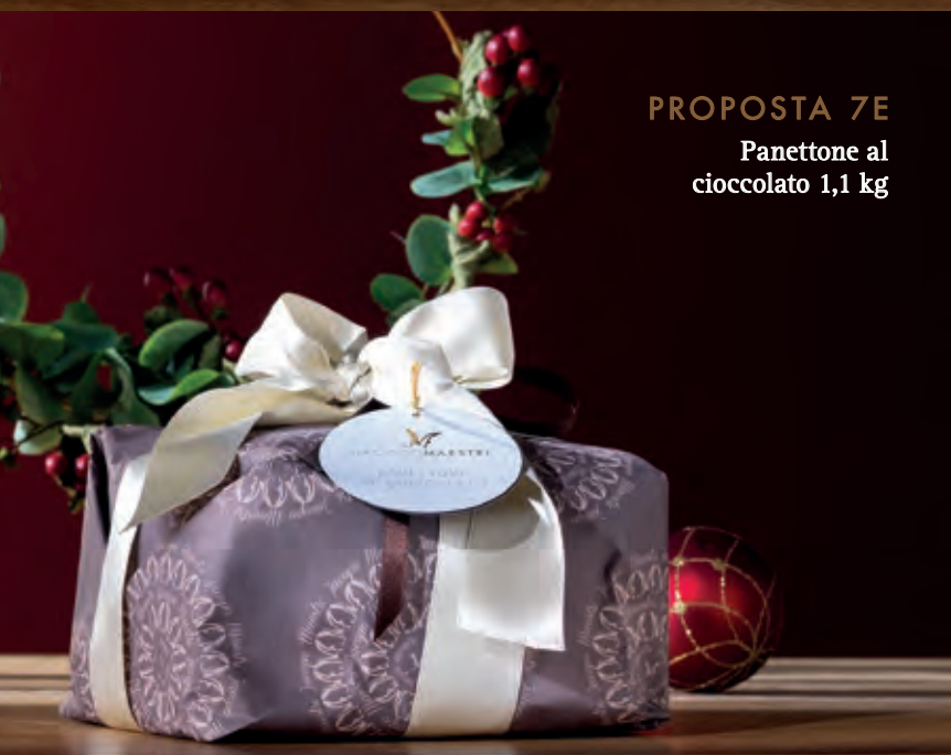
PROPOSTA 7E Panettone al cioccolato 1,1 kg