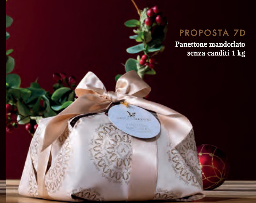
PROPOSTA 7D Panettone mandorlato senza canditi 1 kg